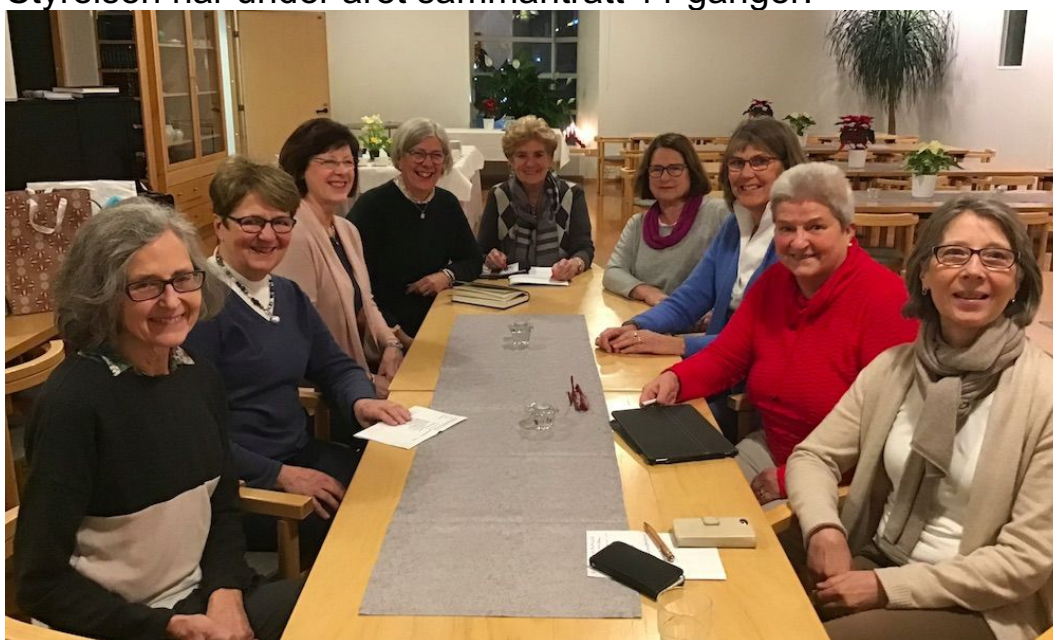
Den gamla styrelsens sista möte i januari 2019

Styrelsen har under året sammanträtt 11 gånger.