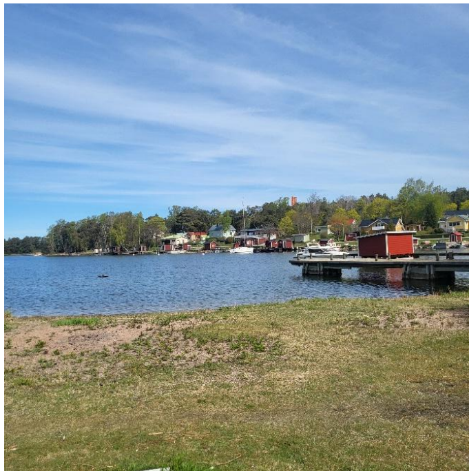
Kapellhamnen och Riviln