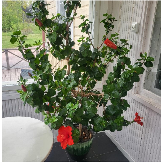
En prunkande hibiscus på Villa Kosthålls veranda